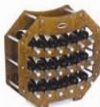
Modello Ottagono P.: