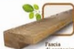
Fascia di contenimento

Sono costruiti in robusto legno massello Pino di prima qualità, già pronti per formare una pavimentazione, si devono solo poggiare a terra, su una superficie più o meno piana, facendo coincidere gli incastri, sono componibili in modo da adattarsi a tutte le superfici. Poggiano su piedi in gomma rialzati dal suolo mm 5, che favoriscono il drenaggio dell'acqua. Questo tipo di pavimentazione è adatto sia per l' esterno che per l' interno , ideale per ricoprire qualsiasi tipo di superficie come il bordo piscina, pavimenti in: sabbia, terra battuta, cotto, cemento, etc. percorsi o semplicemente per rendere più eleganti gli ambienti quali terrazze, balconi, cortili, gazebo, verande etc. Finitura: Noce