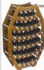
Modello Ottagono G.: