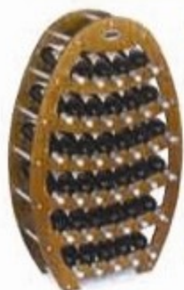
Modello Botte G.:

Le cantinette in legno sono un elemento di arredo e design, ideale per riporre in maniera corretta le vostre bottiglie di vini etc., dandone un pizzico di eleganza. Disponibili in diversi modelli e numero di bottiglie e nelle finiture acero e noce .