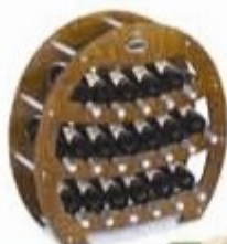
Modello Botte P.: